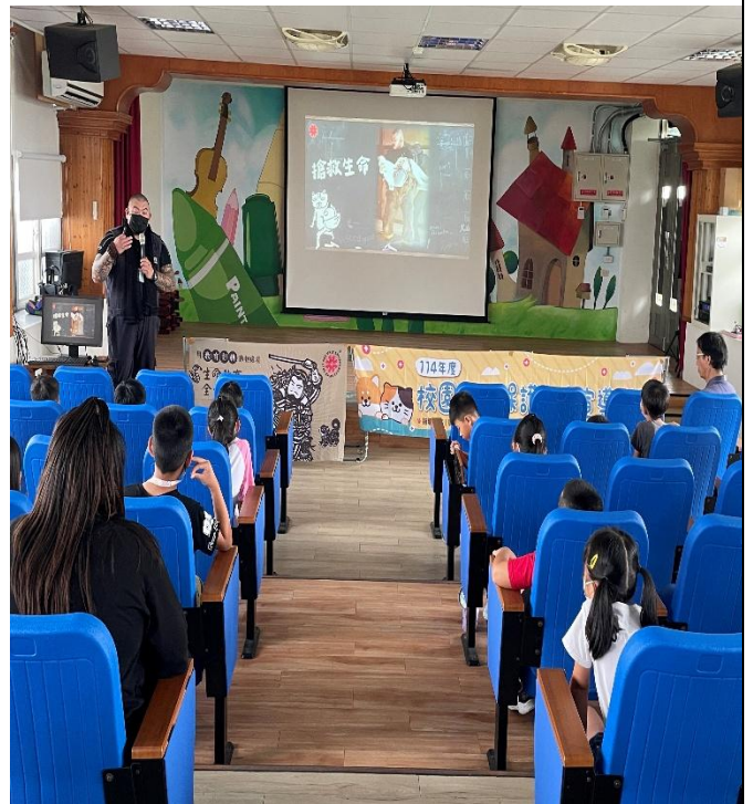
申請台灣 NOE 動保組織到校做動保宣導。