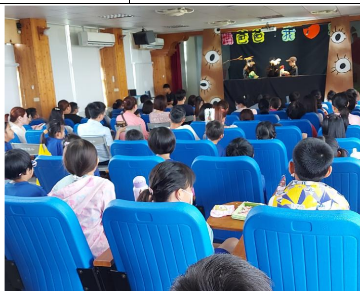
母親節活動-全國偶劇比賽作品展演，與家人分享我們的驕傲。