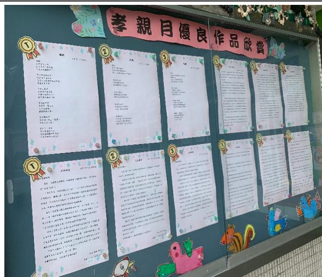
孝親比賽作品在母親節活動當天展出-作文