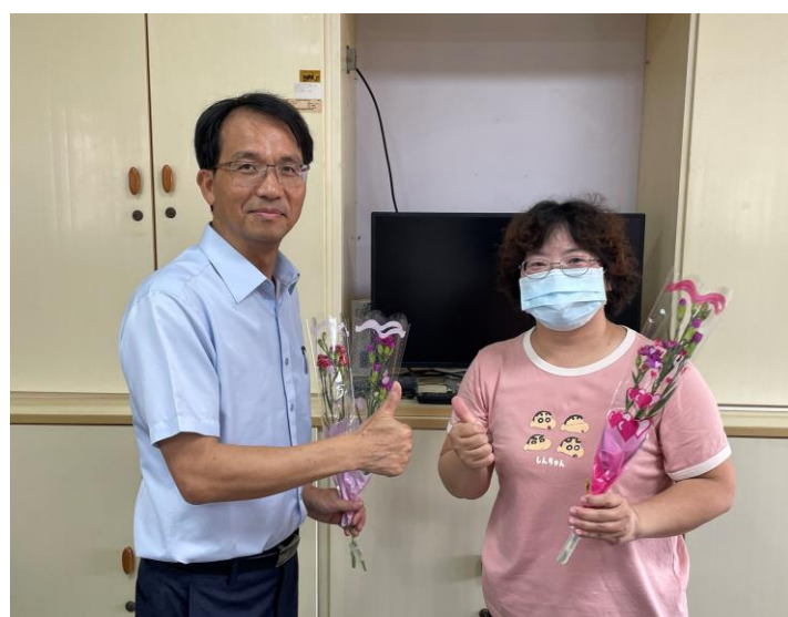
家長會準備康乃馨花，由校長代表致贈。