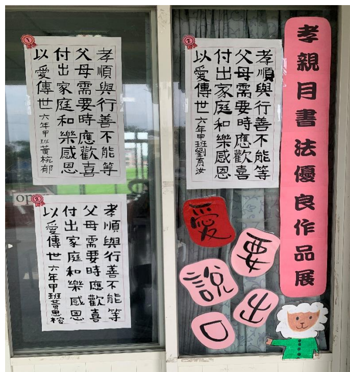
孝親比賽作品在母親節活動當天展出-書法