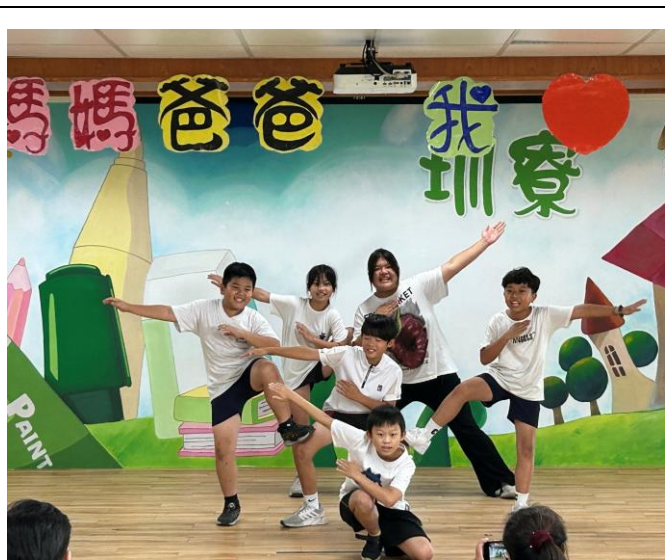
母親節表演活動-各班精心準備表演活動，獻給平日為他們付出辛勞的家人。