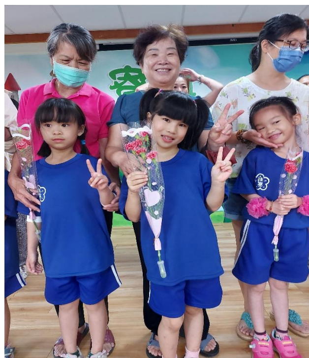
母親節活動-贈送家長康乃馨與卡片