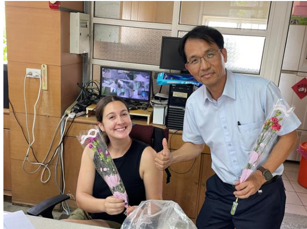
家長會準備康乃馨感謝同仁們平日將孩子們視如己出的盡心付出。