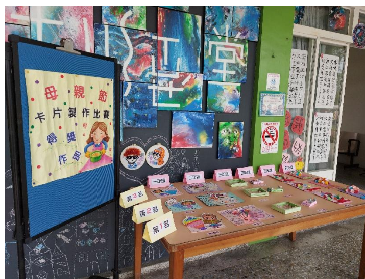
孝親比賽作品在母親節活動當天展出-卡片